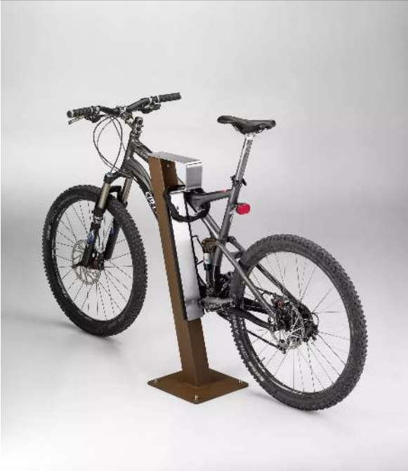
Anlehnbügel FOXHOUND mit Flachstahlbügel aus Edelstahl, Stahlteile in CORTEN