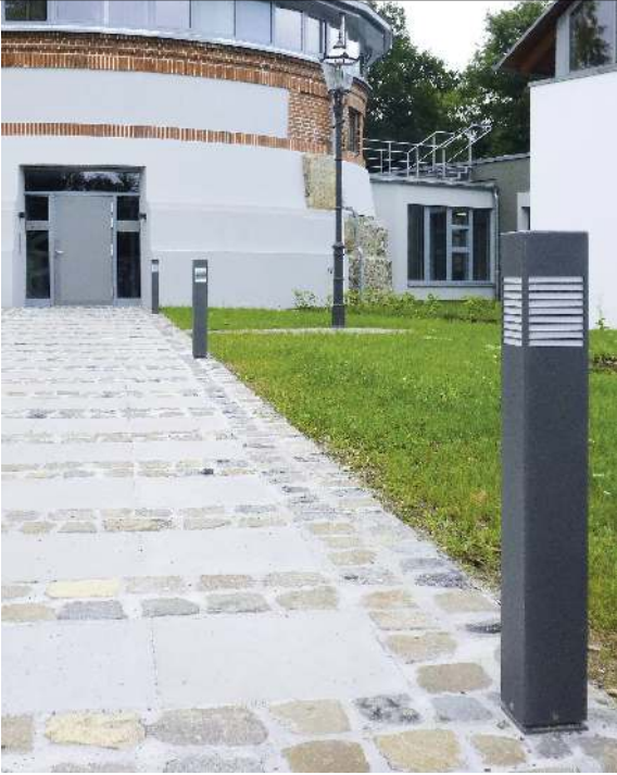
Pollerleuchte DIEST, Höhe 900 mm, kleiner Lichtaustritt