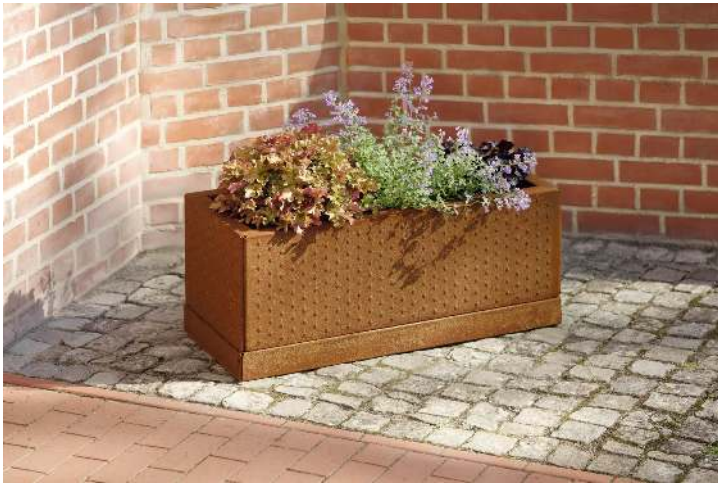
Pflanzbehälter TILLEY, rechteckig, aus Cortenstahl