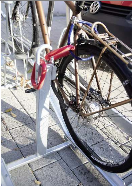
Doppelstock-Fahrradparksystem EASYLIFT 500 D, doppelseitig, 8 Stellplätze