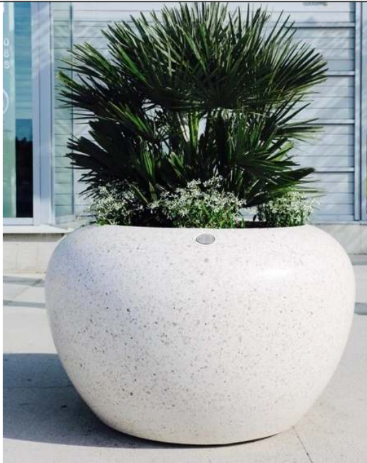
Pflanzbehälter LUNAO aus Beton geschliffen, in Granitoptik weiß