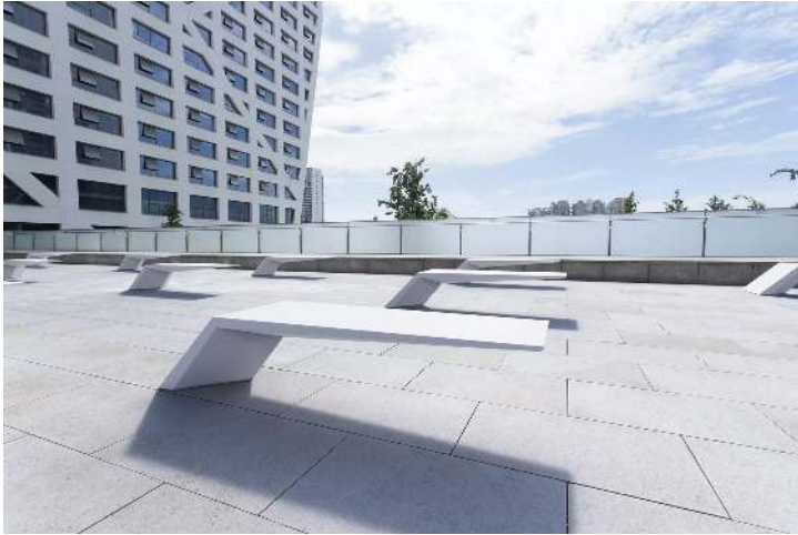
Sitzbank WING aus UTC®-Beton, in weiß<br><br><br><br><br>