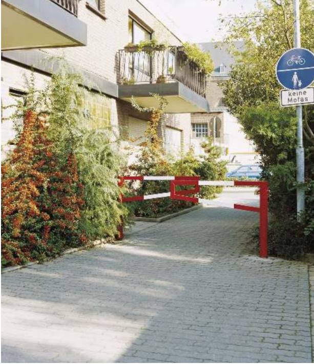
Gatterschranke AMAL - doppelseitig