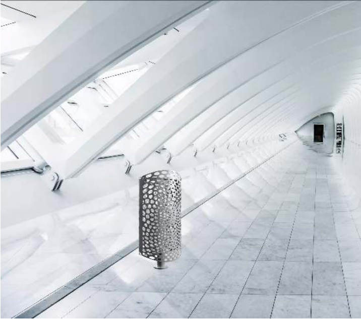
Abfallbehälter KEO in grau 2900 sable