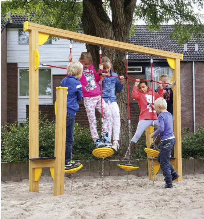
Balancierstrecke OLIVER, Element E